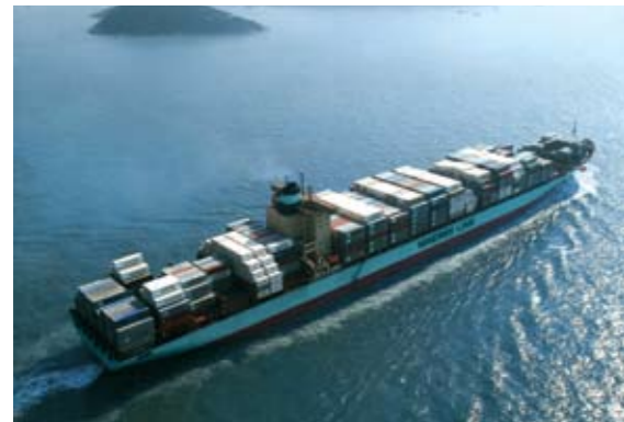
Spéciale Tanger- Méditerranée "TMSA" en charge de la réalisation de ce nouvel espace économique à la

En lançant le complexe portuaire Tanger-Med qui s'articule autour du port, des zones franches industrielles et logistiques, et des infrastructures de connexions, l'Etat Marocain a voulu donner une nouvelle dimension au développement de la Région du Nord et a créé à cet effet l'Agence