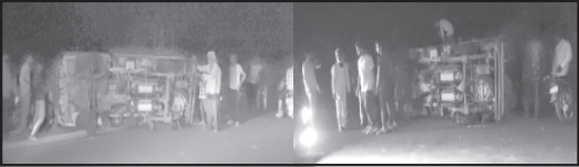
બગસરા, તા.૨૩ પાણીમાં ટાંકા પાસે સ્વાન આડુ પડતા કાબુ ગુમાવતા પલટી મારી ડ્રાઈવરનો બગસરા જેતપુર રોડ મીનીટેમ્પો કેરી સાઈડોડોઝાબરેલેટમ્પો ચમત્કારી બચાવો થયો હતો.

‘પુષ્પા’ પછી હવે ‘શ્રીવલ્લી’નું જોવા મળશે ટશન : પુષ્પા રનું બીજું ગીત