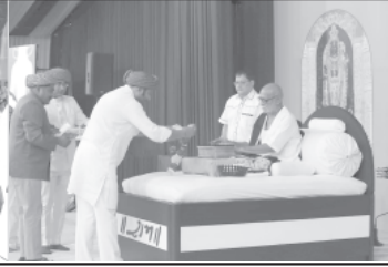
દિવસની કથામાં પ્રવેશ કરતાં કહાંકે આજે બુદ્ધ પૂર્ણિમા છે. ભગવાન બુદ્ધ અને વસ્તીના કુલ ૧૦૦ કરોડ લોકો જો એ એક વૃક્ષ વાવે તો આપણે સમગ્ર પૃથ્વી.

ગોડલના લોહ લંગરીધામ આશ્રમના પ્રાંગણમાં ગવાઈ રહેલી ‘ માનસ રામકથા’ના છટ્ટા દિવસના પ્રારંભે ગોડલનારાજવી નામદાર