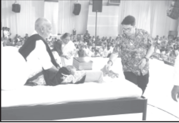
ગોડલ, તા.૨૩ (તખુભાઈ સાંડસુર દ્વારા)

રામકથામાં સંતો-મહંતો અને મોટી સંખ્યામાં ભક્તોજનો ઉપસ્થિત રહી લાભ લે છે