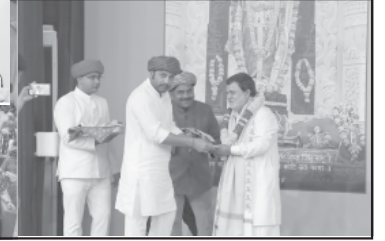
થયું હતું. તથા અન્ય સંતો પણ ઉપસ્થિત હતાં. પુએ કથાના પ્રારંભે સંચાલક આખી કથા ખૂબ ટુંકા સમયમાં

નામની રાજકોની સંસ્થા વૃદ્ધોની સેવા અને વૃદ્ધોની ખૂબ સારી સેવા કરી રહી છે. તેના માટે એક કચા પક્ષ માં આપેલી છે. તેમની પ્રવૃત્તિના આપણે બિરદાવીએ