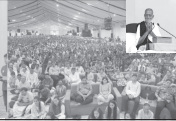
ક એકએક વૃક્ષ વાવવા અનુરોધ કર્યો. આ છીએ. ને જ સંદર્ભમાં બાપુએ કહ્યું કે સદ્ભાવના રામકથાના કમમાં બા

મહારાજા ભગવતસિંહજીને વૃક્ષો ખૂબ વહાલાં હતા. તેમના વૃક્ષપ્રેમને અનુભોદન આપવા માટે અને સમગ્ર જગતની સંખાકારી માટે ભારતની વધુ હરિયાળી બનાવી શકીએ. આપુરુ વ્યાસપીઠ પરથી પુ. સીતારામ બાપુ સમેત સૌને તે માટે વિશેષ વિનંતી કરી તમામ કથાકલાવર્સને પણ વૃક્ષપ્રેમ મા